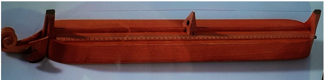
Fig. 1. Monochord

Dit instrument werd door de oude Grieken gebruikt om toonladders mee te bepalen. Pythagoras heeft het instrument gebruikt om de Pythagorasstemming mee te ontwikkelen.