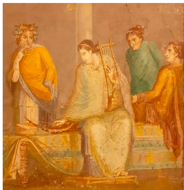
Fig. 2. Mono- en multichord, 100 v. Chr. Fresco uit woning Pompei, museum Napels.

Met die formule kunnen vervolgens toonladders vanuit verschillende grondtonen worden bepaald.