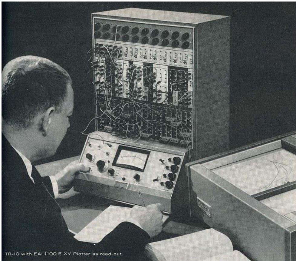
TR-10 with EAI 1100 E XY Plotter as read-out.