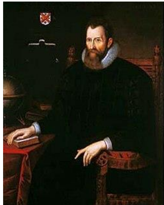
Fig. 2. John Napier (1555-1617), Baron van Merchiston, bij Edinburgh in Schotland.

Wie de Constructio openslaat, ziet (zoals voor die tijd niet ongebruikelijk) een wiskundeboek zonder formules. Wel zien we tekeningen met lijnen die we tegenwoordig getallenlijnen (-assen) zouden noemen, maar die voor Napier dragers waren voor continu in lengte veranderende lijnstukken en niet van getallen. Het coördinaatbegrip was nog onbekend. Zijn wiskunde is dus voornamelijk meetkundig van karakter. Al zijn wiskundige beschrijvingen zijn echter talig, wat van de hedendaagse lezer van de Constructio de nodige inspanning en een vertaalslag vraagt. Die moet steeds de tekst bevragen wat Napier bedoeld kan hebben, uitgedrukt in de hem/haar meer vertrouwde, modernere, mathematische terminologie. In de eerste paragraaf van de Constructio lezen we: “it (= the Logarithmic Table) picked out from numbers progressing in continuous proportion”. Dat voor elkaar krijgen zonder de latere continuïteitswiskunde is een bewonderingswaardige prestatie.