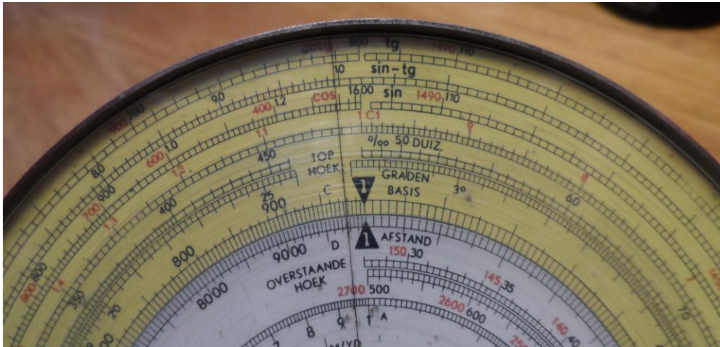
Fig. 1. Schalen op de ALRO Militaire Rekenshijf.

Deze normale schalen zijn doorlopend, een voordeel van een rekenshijf ten opzichte van een liniaal met eindige lengte. De goniometrische schalen \text{tg} , \text{sin-tg} en \text{sin/cos} zijn niet doorlopend, net als de speciale schalen ‘overstaande hoek’ en ‘tophoek’. Een snelle blik in de catalogus van het ISRG leert dat goniometrische schalen op rekenshijven nauwelijks voorkomen en als ze voorkomen dan zijn deze ook discontinu.