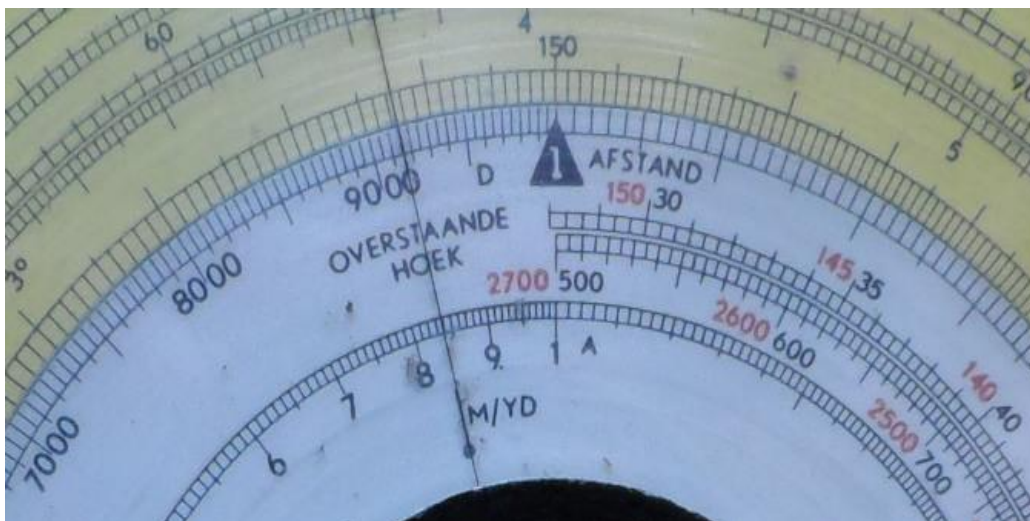
Fig. 2. Conversie van yards naar meters.

Deze normale schalen zijn doorlopend, een voordeel van een rekenshijf ten opzichte van een liniaal met eindige lengte. De goniometrische schalen \text{tg} , \text{sin-tg} en \text{sin/cos} zijn niet doorlopend, net als de speciale schalen ‘overstaande hoek’ en ‘tophoek’. Een snelle blik in de catalogus van het ISRG leert dat goniometrische schalen op rekenshijven nauwelijks voorkomen en als ze voorkomen dan zijn deze ook discontinu.