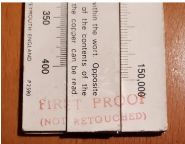
Fig. 2. De vermelding FIRST PROOF NOT RETOUCHE d rechts op de voorkant.

Bijzonder is dat er de naam Blundell Rules LTD Weymouth England op staat, alsmede het typenummer P2590, terwijl er rechts in rood de opmerking FIRST PROOF NOT RETOUCHE d te vinden is. Zie figuur 2.