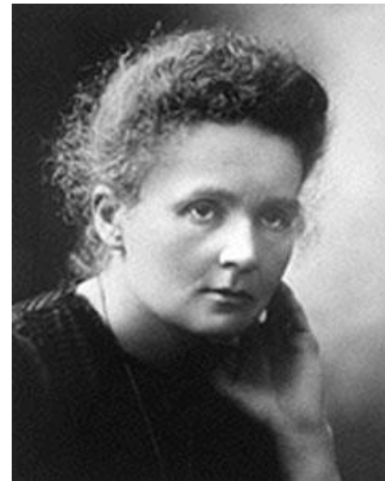
Fig. 2. Marie Curie (1867 – 1934)