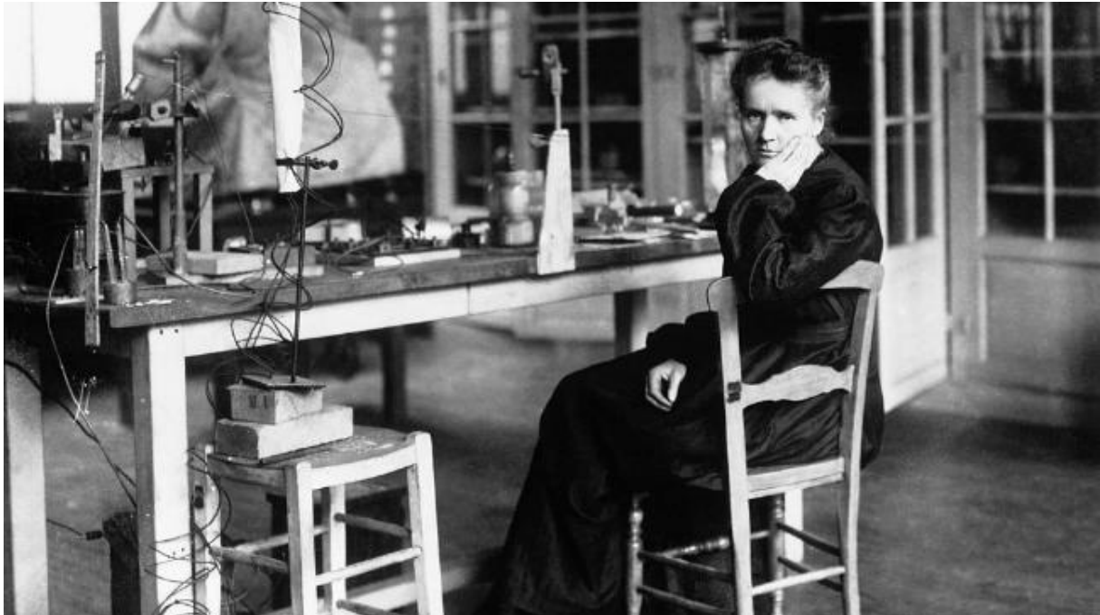
Fig. 6. De tafelblad-experimenten van Marie Curie.

Het kleine laboratorium van de Curies in Parijs (nu museum) laat de werktafel van Marie Curie zien, met een aantal van de door haar gebruikte instrumenten. Naar de huidige maatstaven van de techniek primitief, maar zeer intelligent geconstrueerd en kennelijk heel effectief voor de taak waarvoor ze bedoeld waren. Je hebt het gevoel dat je zo met haar experiment mee kunt doen. (Ware het niet dat je nergens aan mag komen). Zie figuur 6.