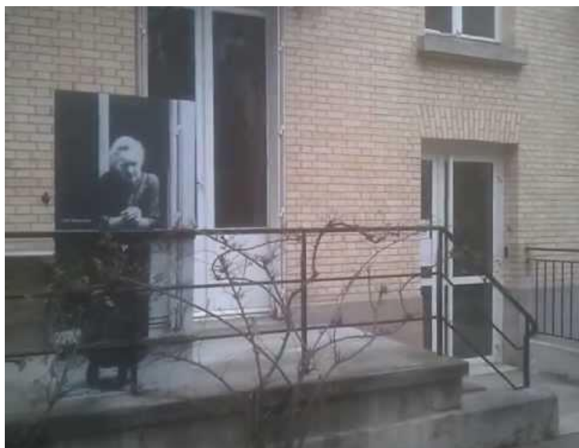
Fig. 7. Marie Curie die uitkijkt over de door haar ontworpen tuin achter het lab/museum.

Achter het laboratorium bevindt zich een kleine tuin met bijzondere planten en bomen, ontworpen door Marie Curie. Daar kun je op een bankje zitten en kijken naar het gebouw en het trapje van een balkonnetje naar de tuin. Daar kun je Marie zo voor de geest halen zoals ze daar staat op die foto uit 1923, diep in gedachten verzonken.