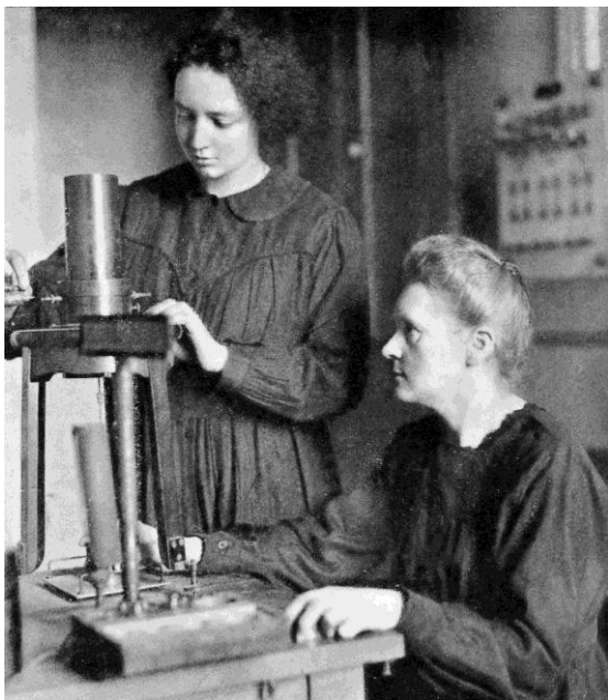
Fig. 4. Irène die haar moeder assisteert bij een experiment.

Wie het museum binnen komt, ziet op een muur schuin tegenover de ingang een foto van zo'n 2 bij 1,5 meter, met daarop de gezichten van Marie, Pierre, maar ook van hun dochter Irène (1897 – 1956) en diens man Frédéric Joliot (1900 – 1958).