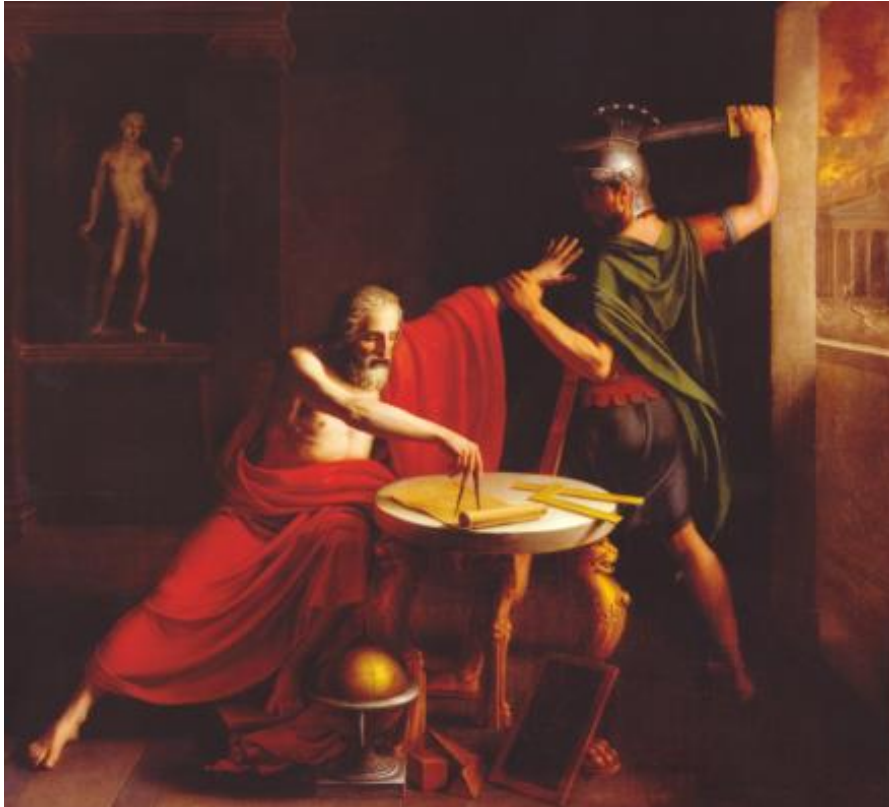
Fig. 5. De dood van Archimedes uit 1815 door de Fransman Thomas Degeorge (1786 – 1854)