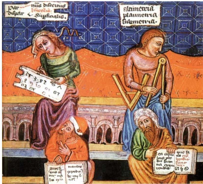
Fig. 3. Miniatuur uit de 14 e eeuw met links de algebraïcus Pythagoras (alles is getal) en rechts de meetkundige Euclides met passer (alles is vorm).

De Westerse cultuur heeft de klassieke Griekse beschaving als belangrijke oorsprong. Wiskundigen uit de Griekse tijd, zoals Thales, Pythagoras, Hippocrates, Euclides, Eratosthenes, Archimedes en vele anderen, zullen zeker een passer hebben gebruikt. Van geen van hen is een eigentijdse afbeelding op fresco's, tabletten of mozaïeken bekend. Wel zijn beeldhouwwerken vervaardigd, met als voorbeeld de buste van de bij scholieren bekende Pythagoras (6 e eeuw voor Christus), die de stelling heeft geformuleerd over de relatie tussen de lengtes van de zijden in een rechthoekige driehoek.