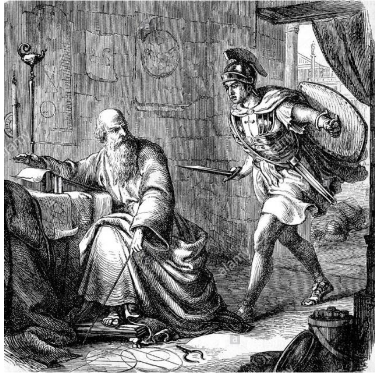
Fig. 6. Het laatste uur van Archimedes. Gravure uit 1882, verschenen in een boek van Charlotte Mary Yonge.