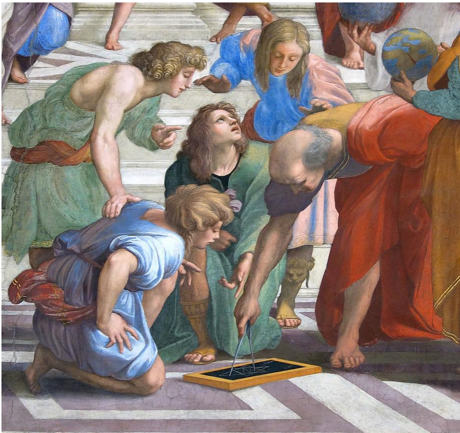
Fig. 4. Detail van de School van Athene, van Raphael, geschilderd in 1509/1510. De fresco bevindt zich in de zaal Stanza della Segnatura, in het Vaticaan. Het detail toont Euclides, gebogen over een meetkundige figuur, uitleg gevend aan leerlingen.