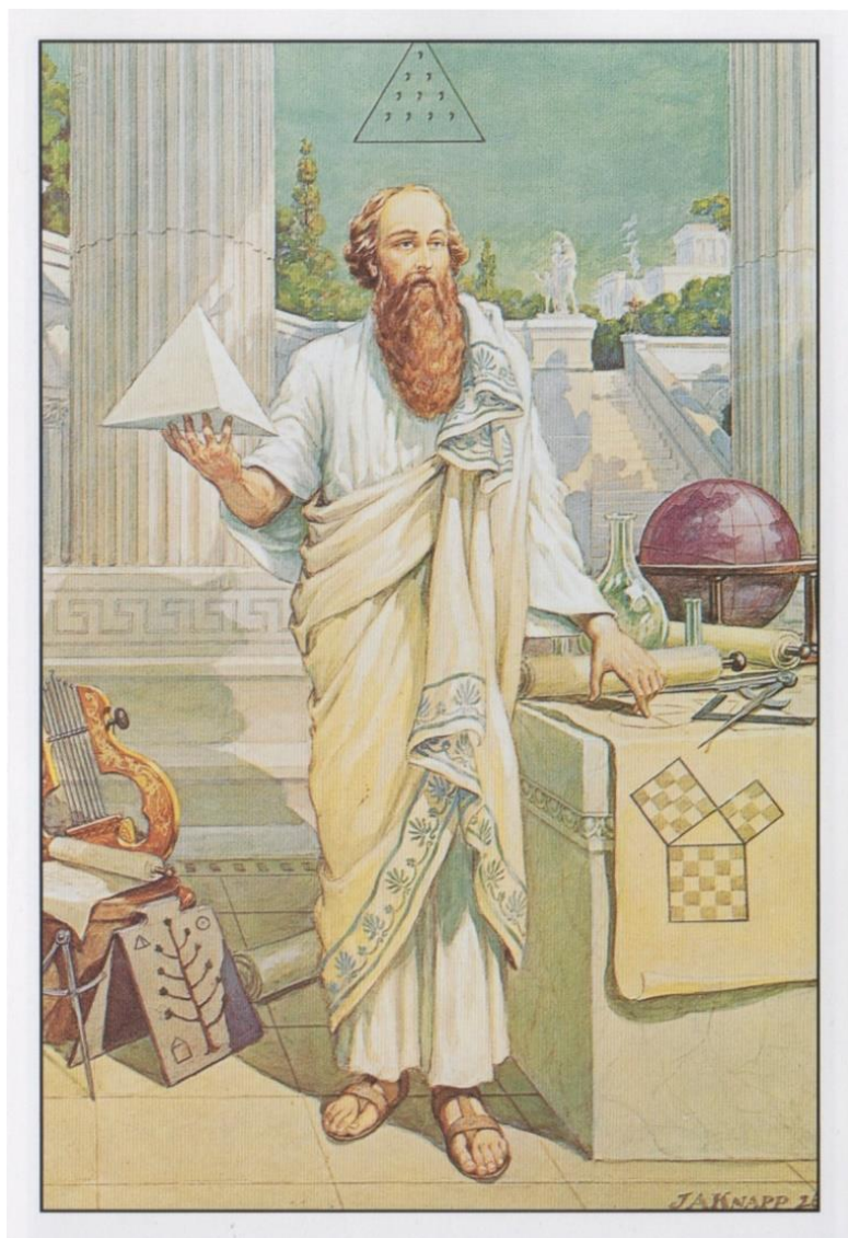
Fig. 2. Pythagoras of Crotona uit 1926, door de Amerikaanse kunstenaar John Augustus Knapp (1853 – 1938).