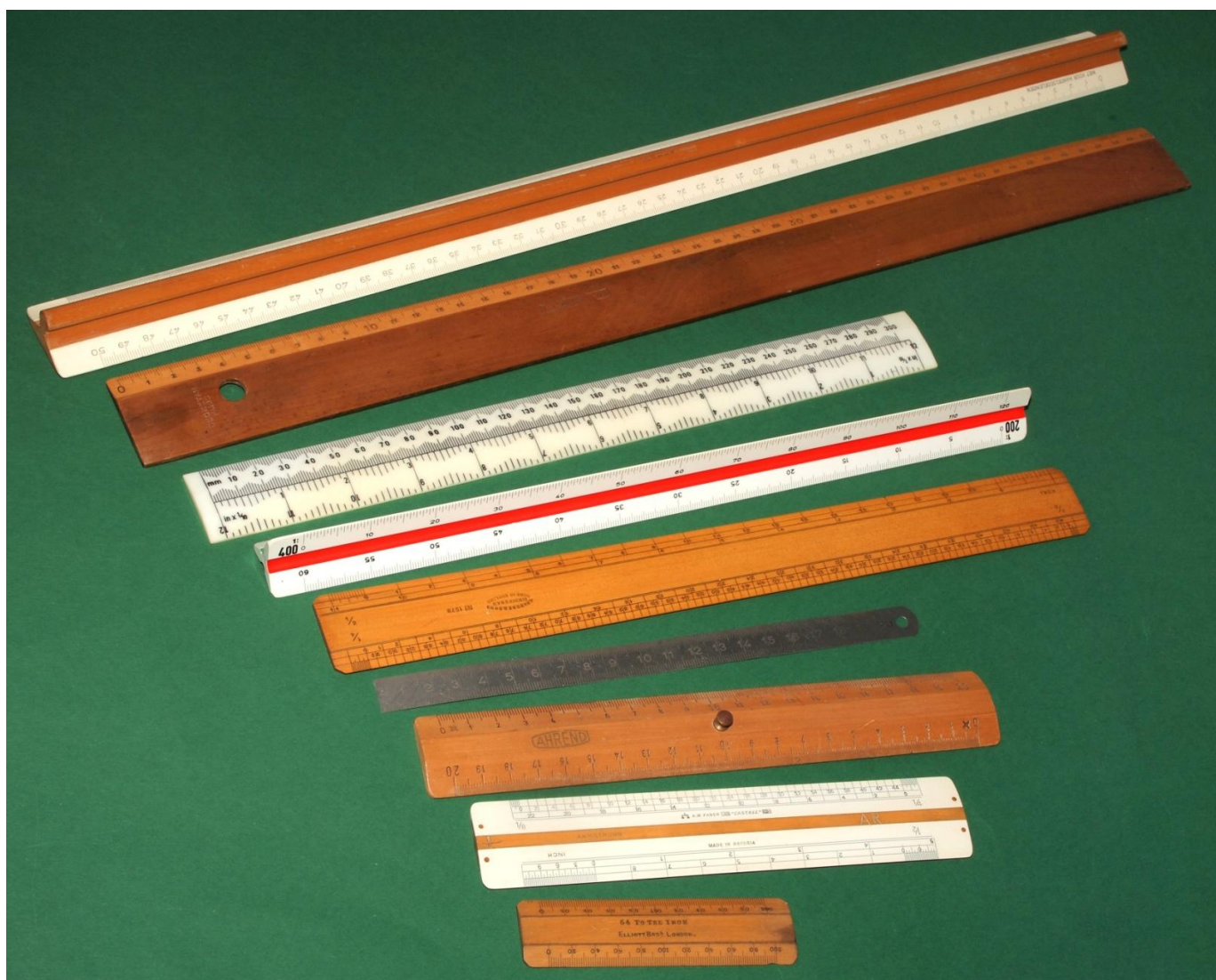
Afb.1. Diverse gewone linialen.