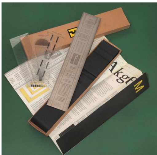
Afb. 4. Mackie M liniaal voor grafische ontwerpers

Een andere liniaal met bijzondere informatie is in 1997 ontworpen voor de typografische industrie door Joep Bohlen van uitgeverij Fontana te Roermond: de meetset Mackie M . Deze metalen liniaal bevat, tussen de 32 cm-schaal en de 70-punts Didot-schaal, veel informatie over letters, corpgroottes, punten en bladformaten; er zijn ook drie transparante sjablonen om in drukwerk te kunnen meten aan hoeken, picapunten versus millimeters, en raster lijndichtheid; op de achterzijde staan keyboard shortcuts voor de grafische software van Apple. Net als elke special purpose rekenliniaal, geeft ook deze liniaal een doorkijkje naar een aparte wereld van specialisatie: in dit geval die van typografen.