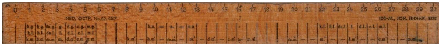
Afb. 3. Schoolliniaal volgens patent 95204 van Joh. Iddink

Eenvoudige linialen met slechts één enkele schaal hebben ruimte te over om te bedrukken met nuttige informatie of reclame. Een voorbeeld is een liniaal voor de lagere school, gepatenteerd in 1939-41 door Johannes Iddink, schoolhoofd te Ede. Zie afbeelding 3. Hierop zijn gestructureerde tabellen toegevoegd voor lengte-, oppervlakte- en inhoudsmaten, evenals decimale voorvoegsels.