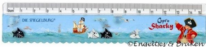
Afb. 5. Leuke liniaal

Van de gewone liniaal bestaan ontelbare versies met extra opdrukken, variërend van uiterst nuttig (denk aan vademecum/tabellen) tot ronduit commercieel of wat opgeleukt voor een doelgroep. Bijvoorbeeld voor schoolkinderen. Zie afbeelding 5.