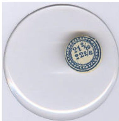
afb. 2 – double lunette, cut top (niet goed te zien)

Jaren geleden ben ik begonnen met het verzamelen van oude zakhorloges. Niet zelden moest er wat aan worden gerepareerd. Helaas durfde in mijn directe omgeving geen enkele horlogemaker te beginnen aan mijn oude zakhorloges. Door de nood gedwongen ben ik toen vrijetijds-horlogemaker