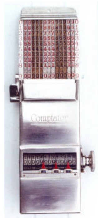
afb. 2 – 13 rijen