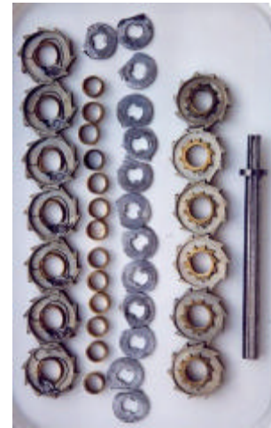
afb. 6 – Alle onderdelen van het resultaatregister. De dertien tandwielen zijn in voor- en achterzijde weergegeven.