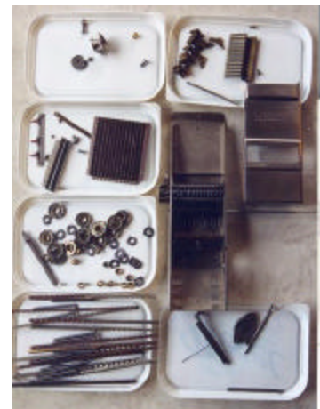
afb. 9 - Alle schoongemaakte onderdelen bij elkaar; 120 stuks, veren en schroeven niet meegerekend