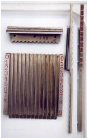
afb. 4 – Instelbord, tandheugel en veerplaat.