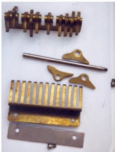
afb. 7 – Pallen en veren voor het resultaatregister.