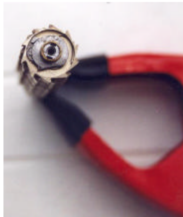
afb. 8 – In tang: gemonteerde situatie van het resultaatregister.