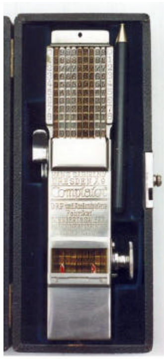
afb. 1 – 9 rijen

De cijfers aan de rand van de machine zijn de zogenaamde complementaire cijfers. Deze worden gebruikt om af te trekken.