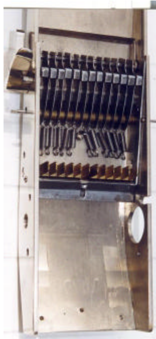
afb. 5 – Tussenstap van de montage van schone onderdelen.