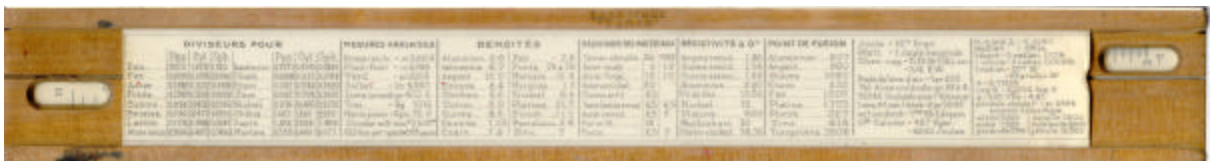
achterzijde met tabellen en gesloten vensters