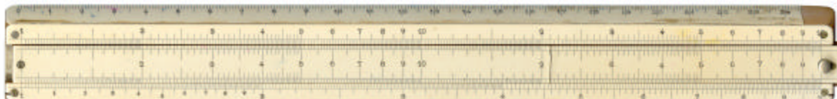
Tavernier-Gravet, type 'Soho'

De overeenkomst tussen Barbotheu [1] en deze Tavernier-Gravet-liniaal kan nauwelijks op toeval berusten.