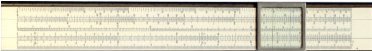
Barbotheu [3], voorzijde