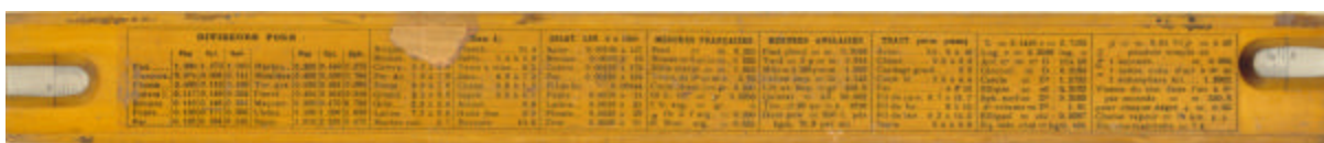
achterzijde; tabel en links en rechts open afleesvensters